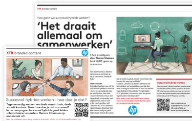
Print met QR-code