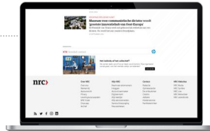
Aanjaging met banners